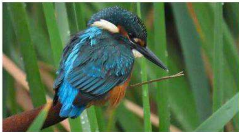
Le martin-pêcheur a une habitude surprenante : il creuse son nid dans le sol, en forme de tunnel.