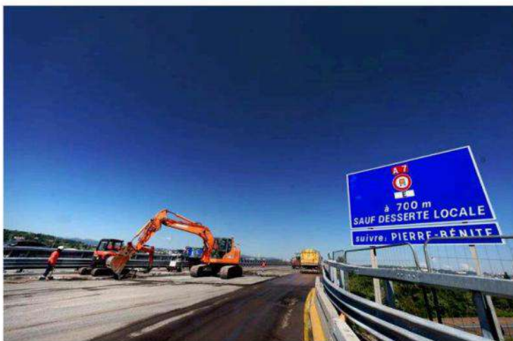
En 2025 déjà, la circulation avait été coupée sur l'A7 durant quatre week-ends de mai, dans le sens sud-nord. Même configuration cette année, mais dans le sens Paris-Marseille, avec la poursuite de la rénovation des viaducs de Pierre-Bénite.