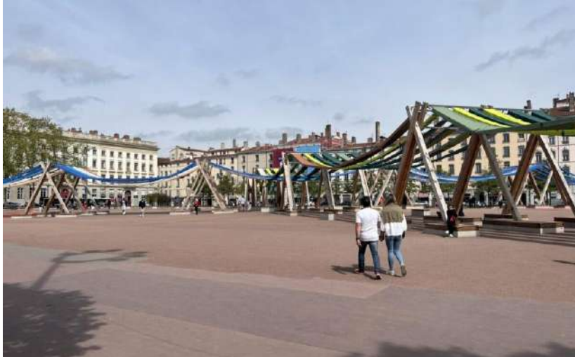
L'Œuvre Tissage urbain est installée place Bellecour (2e arrondissement)

LYON CAPITALES 10/04/26 par Romain Balme