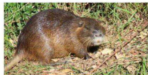
Même si c'est tentant, il convient de ne pas trop approcher les ragondins.

Il serait tentant de s'en approcher. Paradoxalement patibulaires et mignonnes, pour les plus petits, les ragondins ne sont pas effrayés par l'homme. Mais ont la réputation d'être vecteurs de maladies transmissibles à l'homme, notamment la leptospirose, qui se transmet par l'eau contaminée par les urines de rongeurs. Des panneaux d'avertissement sont d'ailleurs installés à proximité du jardin aquatique Ouagadougou, à Confluence. On peut y lire les règles de bonne conduite à adopter pour limiter leur prolifération. Il convient de ne pas s'en approcher, de ne pas les nourrir et ne pas les toucher.