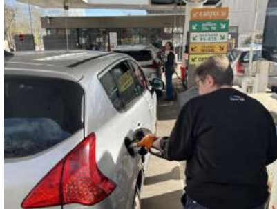
Station Total Energies de l'avenue Tony Garnier, Lyon

Face à l'instabilité des prix du carburant, Jacky Montiel, ingénieur en logiciel, lance ViaMalin. Cette plateforme gratuite permet aux automobilistes de repérer facilement les stations-service les moins chères sur leur trajet.