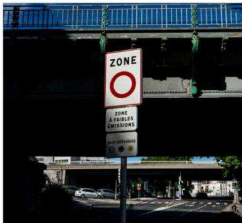
Le périmètre de la ZFE de Lyon concernait uniquement le cœur de l'agglomération.

Ce mardi soir, l'Assemblée a acté la suppression des Zones à faibles émissions dans le cadre de la loi de simplification de la vie économique.