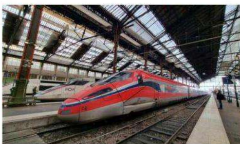
La circulation des TGV va être plus compliquée, le week-end du 1 er mai, en raison de travaux à Paris-Gare de Lyon.

La gare de Lyon à Paris va être fermée du 1 er au 3 mai, en raison de travaux de