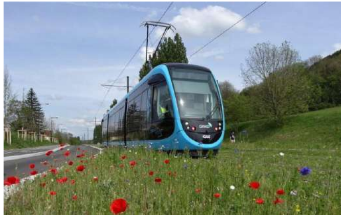
Tramway régional entre Crémieu et Lyon via Meyzieu.