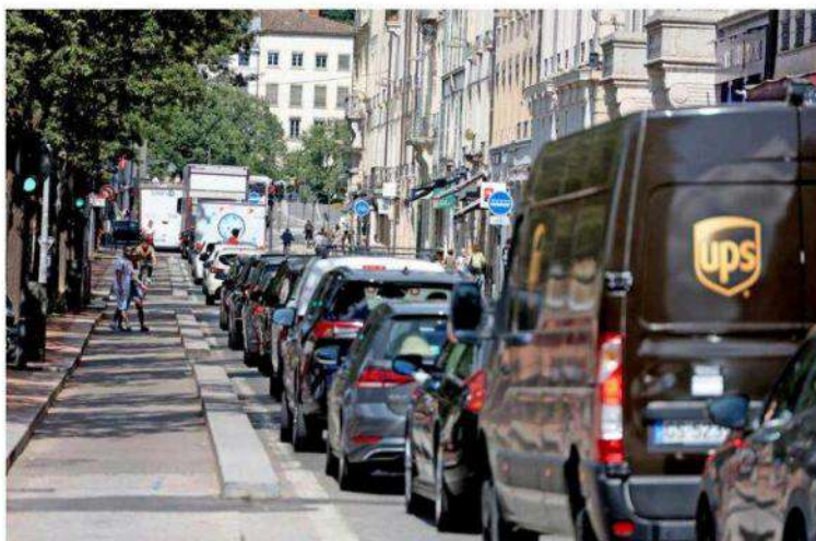
La circulation sur la frange nord de la place Bellecour est constamment paralysée depuis la mise en place de la Zone à trafic limité.

« Notre objectif est de préparer une liste suffisamment exhaustive pour que le nouvel exécutif ait une base de travail », poursuit le responsable, qui convient avoir beaucoup discuté avec les élus de la précédente mandature malgré