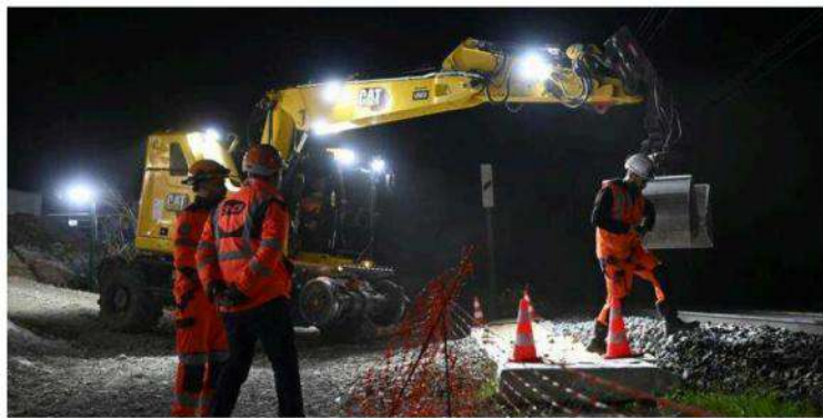
À 22 h 30, la pelle rail-route, avec ses plus de 10 tonnes de mécanique, commence à se diriger vers la voie ferrée.

Objectif du chantier : débloquer la capacité de cette ligne, la plus empruntée de France. Ac-