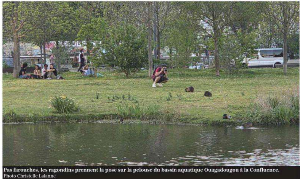
Pas farouches, les ragondins prennent la pose sur la pelouse du bassin aquatique Ouagadougou à la Confluence.

Pour cette raison, et dans le cadre de sa mission de restauration des berges du Rhône et de la Saône, l'association tente, tout en ménageant les autres espè-