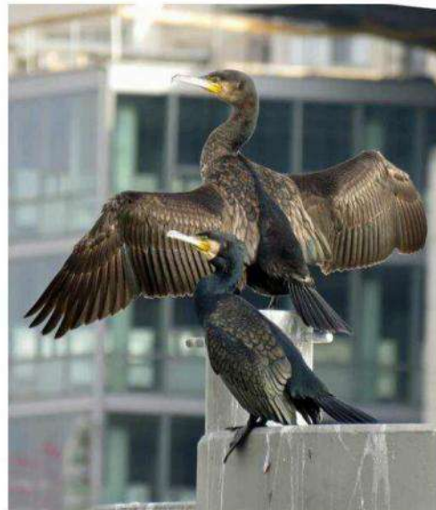
Les grands cormorans affectionnent particulièrement le quartier de la Confluence (Lyon 2 e ).