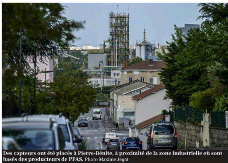
Des capteurs ont été placés à Pierre-Bénite, à proximité de la zone industrielle où sont basés des producteurs de PFAS.

Des capteurs ont été placés à Pierre-Bénite, à proximité de la zone industrielle où sont basés des producteurs de ces substances extrêmement résistantes, et dans le centre-ville de Lyon, pour comparer les niveaux de PFAS en concentration par mètre cube d'air respiré. En tout, ce sont 38 PFAS qui ont