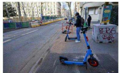
Deux hommes de 19 et 22 ans ont été tués en trottinette par un automobiliste en février 2025.

Si Dott poursuit ses efforts en matière de sécurité, c'est qu'elle devient l'enjeu principal des appels d'offres lancés par les collectivités. Et ce pour de bonnes raisons. À Lyon, plusieurs utilisateurs de trottinettes électriques ont perdu la vie ces dernières années.