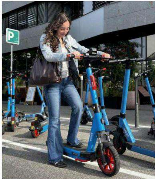
Les nouvelles trottinettes électriques Dott sont équipées de clignotants et d'une batterie améliorée.

Si Dott promet une « capacité de batterie multipliée par deux » ainsi qu'une « stabilité