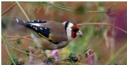
Les chardonnerets souffrent du trafic d'oiseaux en cage. Ils sont très prisés pour leurs chants.