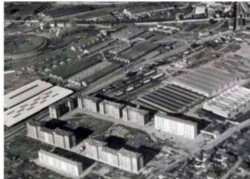
La zone, visible 20 ans après sa destruction.