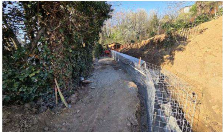
Le chemin est en cours de réalisation. Ici aménagement des soutènements en gabion dans la partie basse.

Créer une « connexion piétonne » entre la Plaine de Vaise (9e) et la crête de Loyasse (5 e ) en lisière des jardins familiaux dans un cadre naturel préservé, tel est l'objectif de ce nouveau chantier qui vient de commencer à Gorge-de-Loup. Cette nouvelle promenade de 440 mètres qui se faufile sur des terres très pentues est réalisée dans le cadre d'une première phase d'aménagement du parc des Balmes.