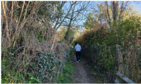
Le sentier réemploie un chemin (presque) abandonné, ponctué d'arbres fruitiers.