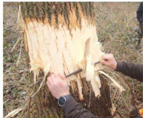
Les agents de la brigade nature ont pratiqué l'écorçage sur une vingtaine d'arbres.