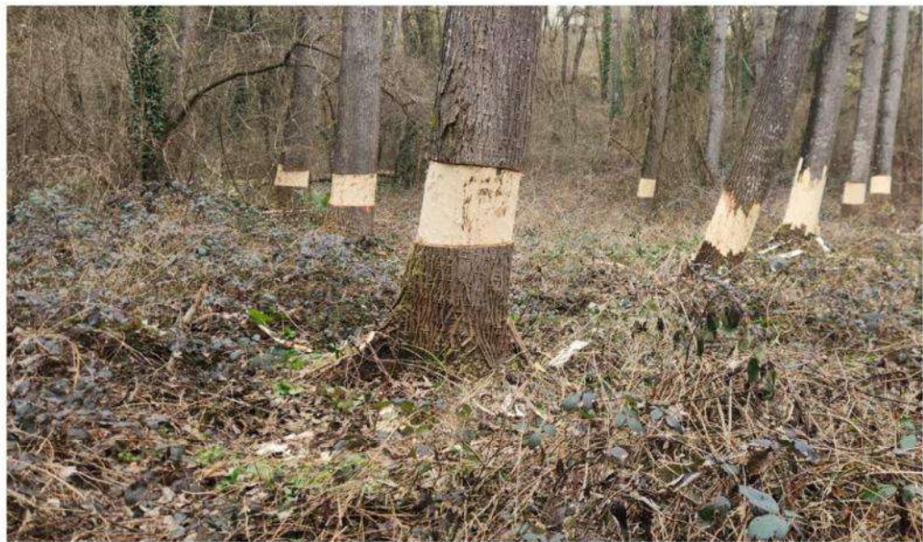
Au fil du temps, ces arbres serviront d'abris à des multiples coléoptères, chiroptères et oiseaux.

« On découpe tout autour du tronc une bande d'écorce d'au moins 10 cm, sinon elle se re-