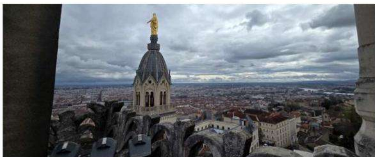
Une vue imprenable sur les toits de Fourvière. C'est ce que peut découvrir le public lors des visites insolites proposées par la Fondation Fourvière; qui sont maintenues en dépit du chantier à venir.