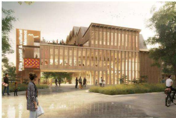
La façade du futur pôle sportif et culturel, depuis la rue Tixier. Visuel Hérault Arnod architectures

La démolition ou la réhabilitation de logements de Grand Lyon Habitat, construits dans les années 1950-1960, notam-