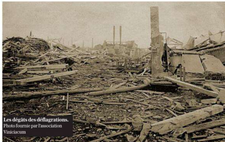
Les dégâts des déflagrations.

Dans la nuit du 15 au 16 octobre 1918, à quelques semaines seulement de l'Armistice, une catastrophe industrielle d'une rare violence frappa Vénissieux et Saint-Fons.