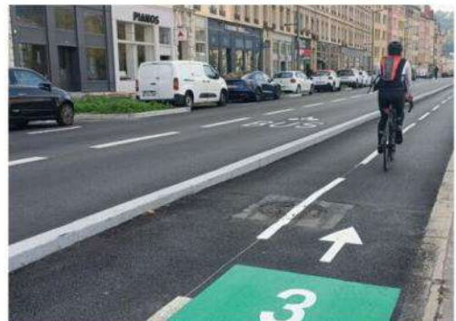
À droite, la voie lyonnaise n° 3 quai Pierre-Scize à Lyon (9 e ). À gauche, les vélos peuvent aussi circuler dans la voie des bus, comme le montre le pictogramme.

On peut compter évidemment sur le bon sens des cyclistes et des amateurs de trottinettes pour utiliser les voies sur lesquelles ils se sentent le plus en sécurité. «Même s'il est généralement conseillé aux cyclistes d'utiliser ces voies dédiées [...] le fait de les rendre facultatives permet à chacun de choisir la partie de la voirie la plus adaptée à sa pratique. Ainsi, un cycliste sportif ou roulant à vive allure pourra privilégier la chaussée, où sa vitesse est plus en adéquation avec le trafic motorisé qu'avec celui, plus lent, d'un aménagement cyclable classique», détaille la collectivité. «Cela permet aussi d'éviter des détours inutiles, en particulier lorsque les amé-