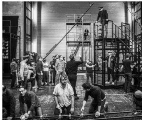
Billy Budd , une première à l'Opéra, du 21 mars au 4 avril.

Véritable procès sur scène, l'opéra remet ici des rôles en question, soulève le poids de la solitude et les notions de justice. Une mise en scène de