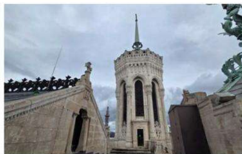
Des fissures sont visibles sur les pierres de la tour, particulièrement exposées aux vents et intempéries.