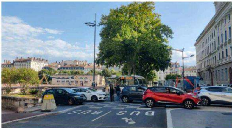
Aux heures de pointe, il devient difficile de s'extraire du parking Bellecour pour s'insérer dans une circulation très dense. Concert de klaxons sous les fenêtres des riverains.

Parmi elles, six concernent la place Bellecour. Si deux usagers évoquent la relative ab-