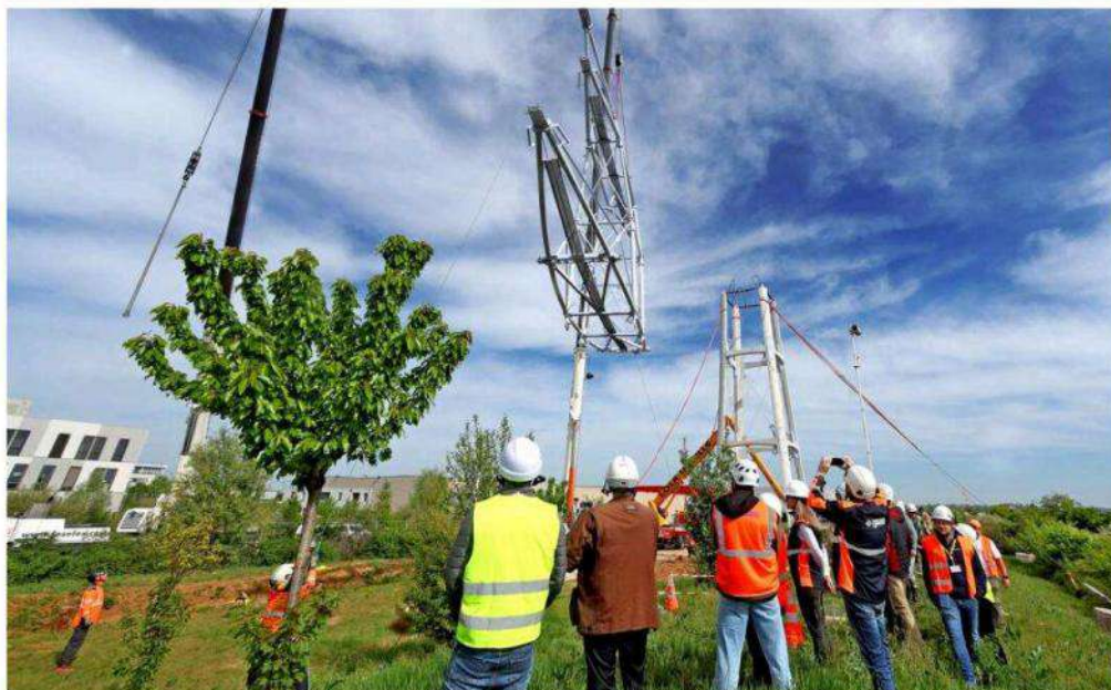
RTE, le gestionnaire du réseau de transport d'électricité, s'apprête à renouveler 85 000 pylônes et 23 500 km de lignes d'ici 2040.

Après avoir investi 226,7 millions d'euros en 2025 (voir par ailleurs), l'opérateur a dévoilé une enveloppe d'1,5 milliard d'investissement sur son réseau d'ici 2030. Une manne essentiellement ventilée selon trois priorités nationales : le renouvellement d'un réseau parfois vieillissant et contraint de s'adapter notamment aux impacts du dérèglement climatique ; le raccordement à de nouvelles zones de consommation à l'instar du parc solaire dont la