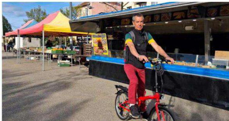
Le marché des Brosses a ouvert fin février.

Depuis fin février, un petit nouveau fait son apparition, les vendredis après-midis, du côté de la place de la Paix, dans le quartier des Brosses. Cette expérimentation de la majorité trouve le soutien des différentes oppositions. « Une bonne nouvelle à saluer » pour