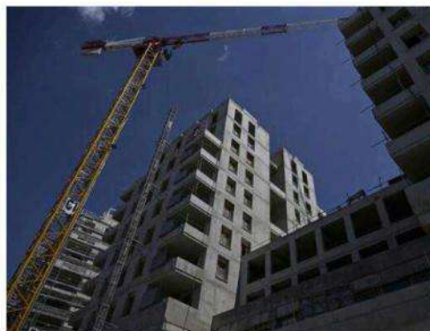
Les travaux de construction du prolongement des Gratte-Ciel ont commencé en 2024 avec le programme Vues ciel du promoteur Quartus.

Les studios de Cogédim, d'une surface inférieure à 30 m 2 , sont un peu plus onéreux puisque