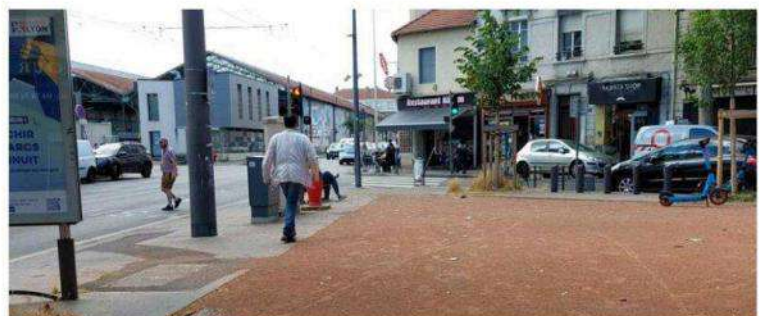
Des riverains des places Henri (photo) et Bir-Hakeim se plaignent de nuisances marquées en soirées et les week-ends.