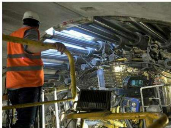
Sur le chantier, en 2019.

Jusqu'à présent, des interactions entre l'eau et le terrain semblent avoir été sous-estimées. Les études géologiques avaient identifié des secteurs compliqués. Les promoteurs du chantier savaient qu'ils devraient faire face à des « convergences fortes » à savoir des risques de décompression, car une fois l'excavation réalisée, le massif a tendance à se refermer. Mais la montagne s'est révélée localement plus