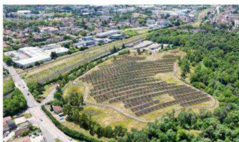
Une version révisée du projet de parc solaire à Rillieux-la-Pape.

Côté production, elle est stable en Auvergne Rhône-Alpes. « Nous sommes plutôt en situation favorable pour