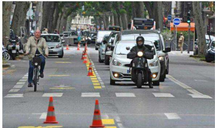
Sur l'avenue de Saxe, la « coronapiste » instaurée durant la pandémie de Covid avait été pérennisée et une seule voie est autorisée aux voitures et motos.